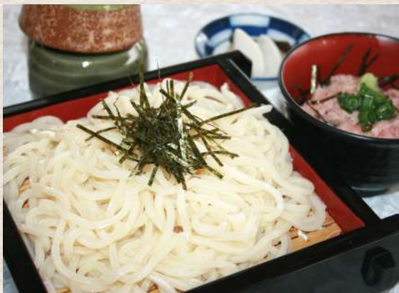
ざるうどん・ざるそば +¥330 ◆ミニねぎとろ丼、お新香付