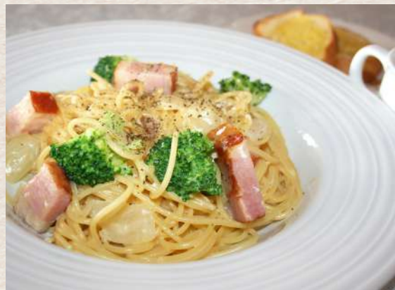
スパゲッティカルボナーラ +¥220 ◆サラダ、バケット、スープ付