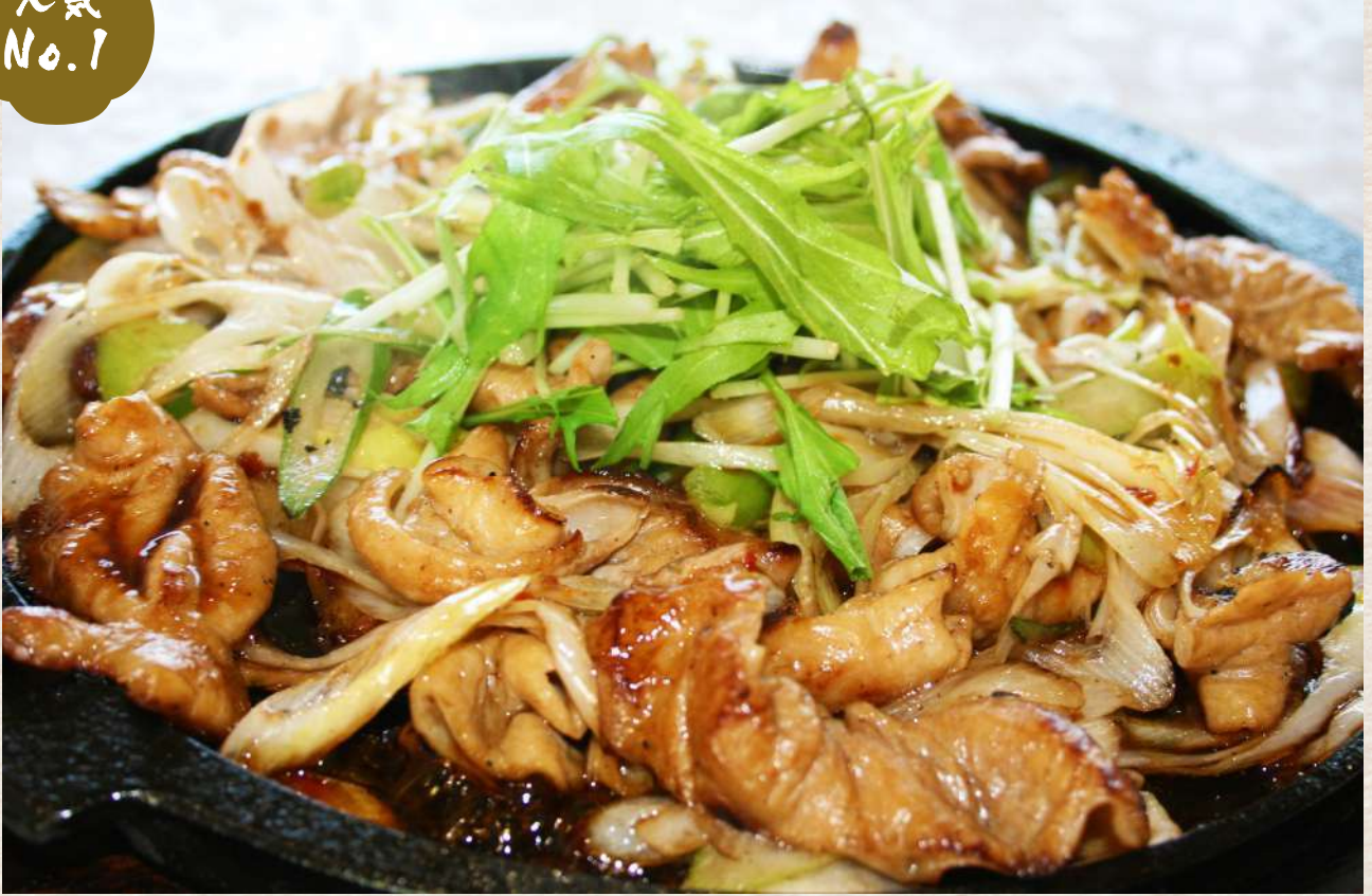
豚ホルモン鉄板焼き