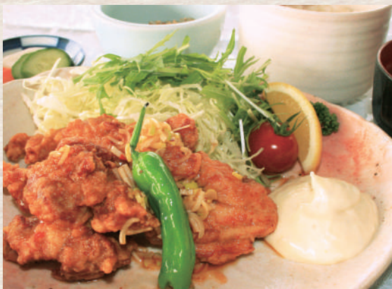
鶏南蛮唐揚げ定食 +¥330

豚ホルモンとネギを特製のタレで炒めた小幡郷 No.1 メニューです。 ホルモンの弾力とネギの甘みがクセになる鉄板焼のセットです。