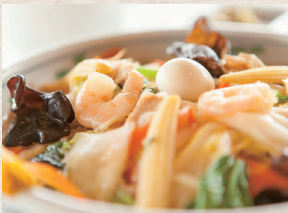
あんかけ焼きそば +¥330 ◆ザーサイ、スープ付