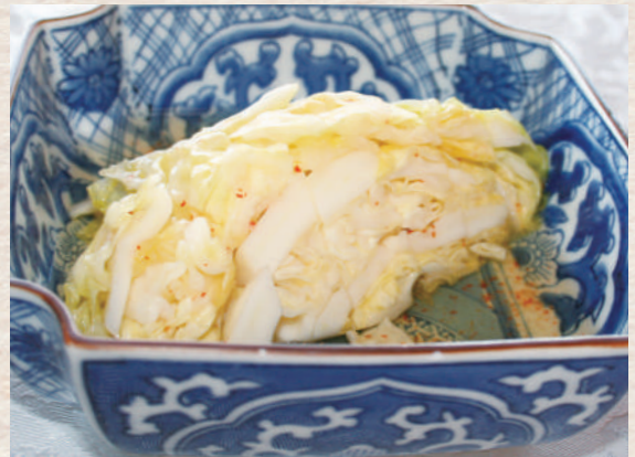
ハルピンキャベツ ¥550