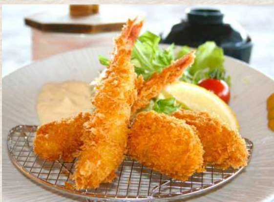
ミックスフライ定食 +¥440 ◆エビ・カキ、お新香、ご飯、味噌汁付