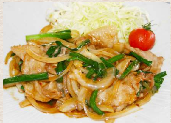
豚バラスタミナ焼き定食 +¥440