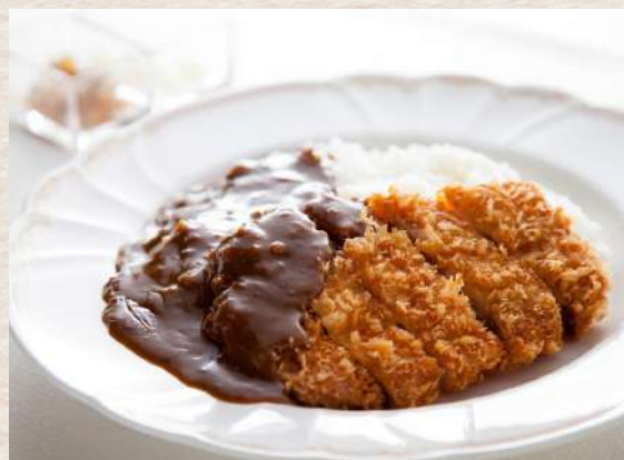
カツカレー +¥440 ◆サラダ、薬味付