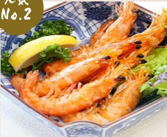
ソフトシュリンプ