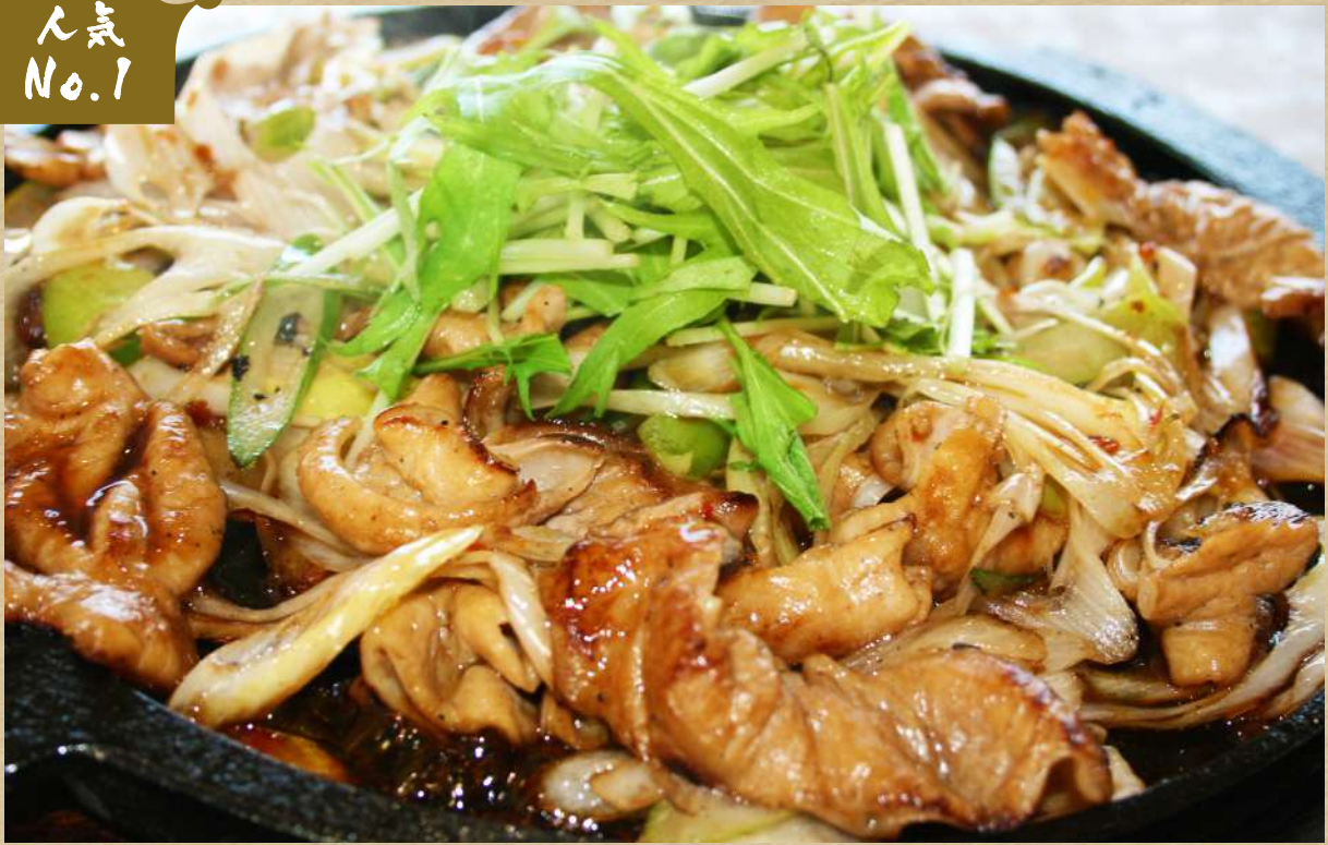
豚ホルモン鉄板焼き定食 ◆お新香、ご飯、味噌汁付